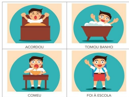
Fonte: Freepik. Disponível em https://br.freepik.com/vetores-gratis/as-tarefas-diarias-em-design-plano_853749.htm#query=atividades%20di%C3%A1rias&position=15 . Acesso em: 1 jun. 2020.

QUAIS SÃO AS ATIVIDADES QUE VOCÊ REALIZOU ONTEM NO PERÍODO DA MANHÃ? E HOJE? E AMANHÃ, O QUE VOCÊ PRETENDE FAZER? ILUSTRE NOS ESPAÇOS ABAIXO: